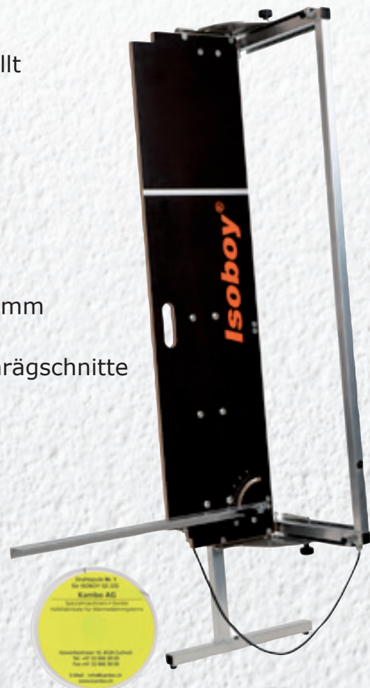
Spezialdrahtspule Nr. 1 Z3200024